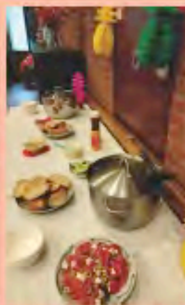
Samen eten buffet