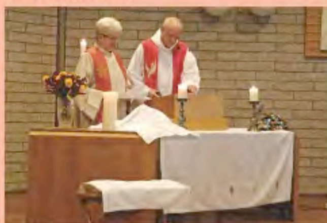
Jubileumdienst 40 jaar Ontmoetingskerk